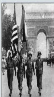
Soldats américains défilant sur les Champs-Élysées

Ces deux terribles guerres opposent la France et l'Allemagne impériale (Première Guerre Mondiale) puis l'Allemagne nazie (Deuxième Guerre Mondiale). Dans ces deux guerres, l'intervention américaine est décisive.